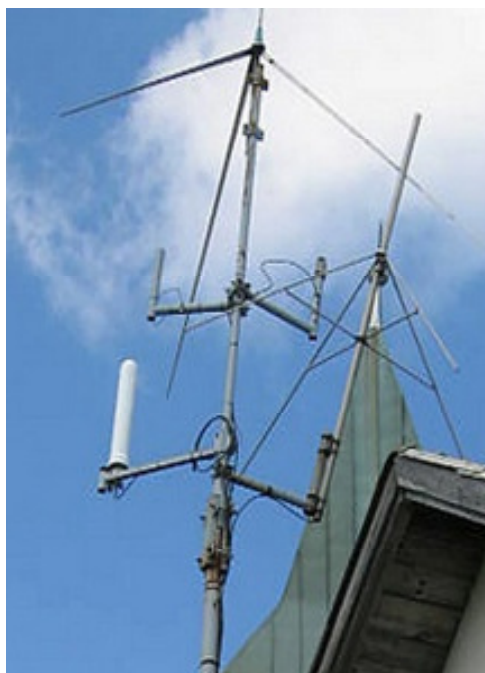
kombinacija mikrovalnih i farova za niže frekvencije < 1GHz ( JN76MC )