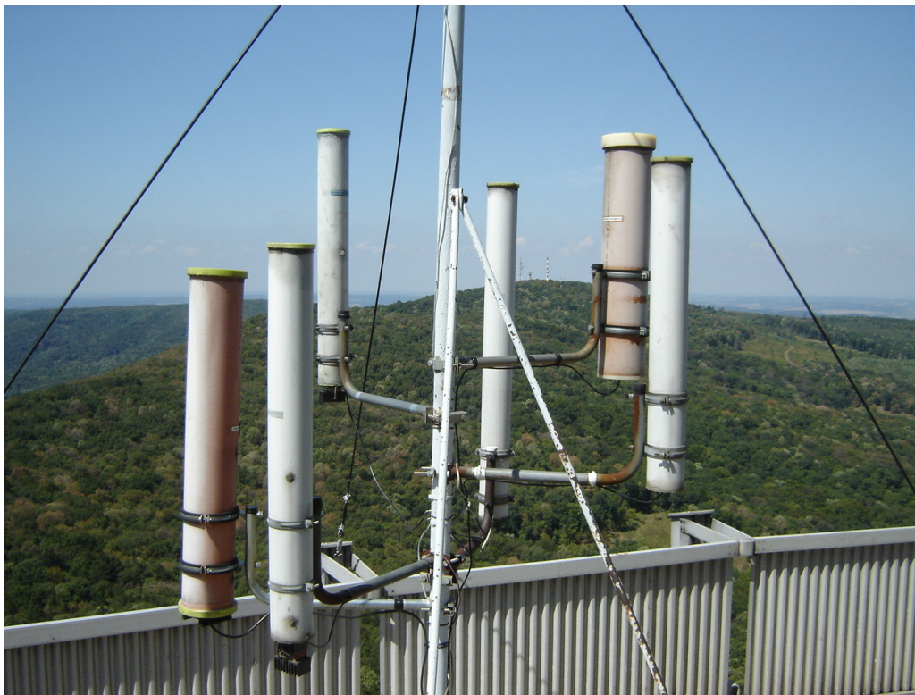
mikrovalni farovi ( na JN96CC )